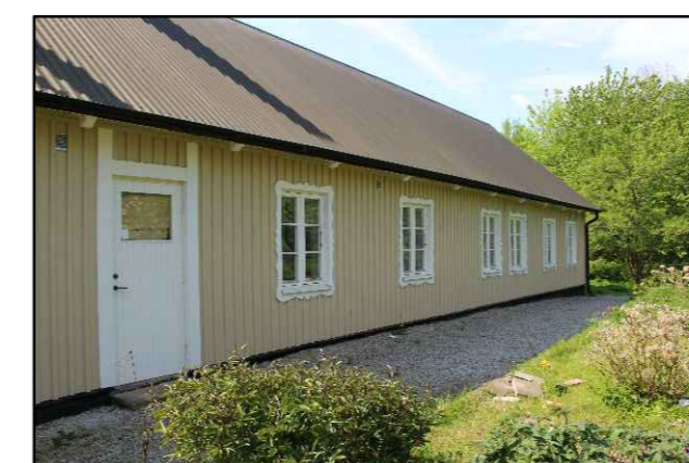
Baksida på gårdslänga regleras genom q 1 , k 1 , k 2 , k 3 , k 4