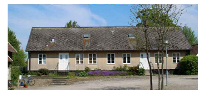
Framsida på gårdslänga regleras genom q 1 , k 1 , k 2 , k 3 , k 4 , k 6