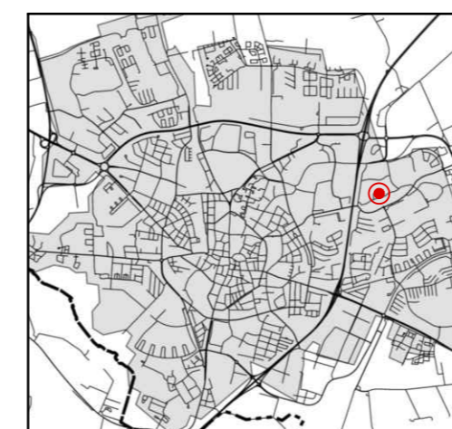
Orienteringskarta över Lund.