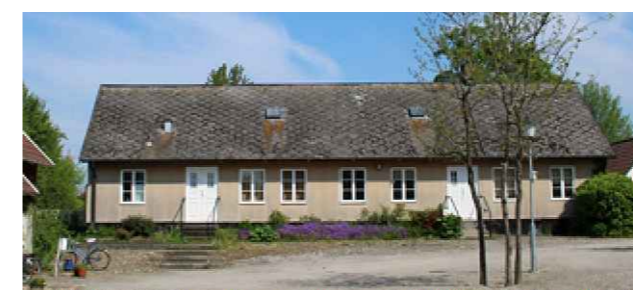
Framsida på gårdslänga regleras genom q 1 , k 1 , k 2 , k 3 , k 4

Genomförandetiden är 5 år från den dag planen vinner laga kraft Marklov krävs vid fällning av träd markerat med n 1 . Marklov krävs vid hårdgörande av yta markerad med n 2 .