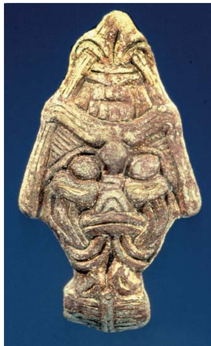
Hängsmycke av brons från vikingatiden. Fynd från Uppåkra som finns på Historiska museet i Lund.

Har Uppåkra en gång varit ett kungasäte? Sedan våren 1996 pågår arkeologiska undersökningar av fornminnesområdet runt kyrkan i Stora Uppåkra . Man har hittat fynd från romariket och dessa fynd talar för att ett säte med religiös och politisk makt har funnits i Uppåkra. Forskarna menar att platsen har haft en betydande roll som ekonomiskt, politiskt och troligen också religiöst centrum utan motsvarighet i Sydsverige. Under sommaren har man öppett i utställningslokalen, den f d prästgården, varje torsdag 15.00-17.45. Grävningssplatsen visas 18.00. För mer information