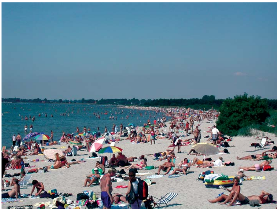
Lomma beach eller kanske Rivieran?

Den här turen går till Lomma som med en mil långgrund strand och möjlighet till både bad och havsfiske lockar många lundabor under sommaren. Vägen dit skär genom det skånska odlingslandskapet som kantas av korsvirkeshus, hamlade pileträd, åkrar och bondgårdar. Hela vägen från Öresundsparken i södra Lomma till Bjärred i norr är en långgrund badstrand med flera möjligheter till bad. En fin avstickare kan man göra till Alnarps slott och park med anor från 1100-talet.