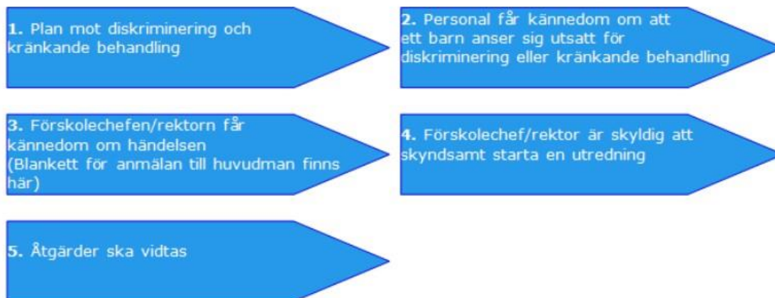
Figur: stödprocess för skolorna inom barn- och skolnämnd Lund stad.