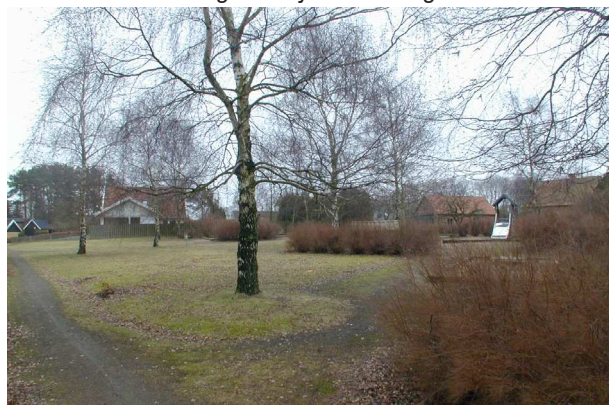
Parken vid Sandvägen - Björkedalsvägen

trafik nå både Vomb och Veberöd. Skåneleden löper strax norr om Torna Hällestad och binder samman byn med Krankesjön och vidare mot Revingeby i norr samt mot natur- och strövområdet Knivsåsen i söder. Nord-sydliga cykelförbindelser sker med cykling i blandtrafik. Torna Hällestad har en mycket fin visuell koppling till landskapet med många vackra vyer över hästhagar och odlingslandskap med rumsavgränsande trädrader och skogsdungar.