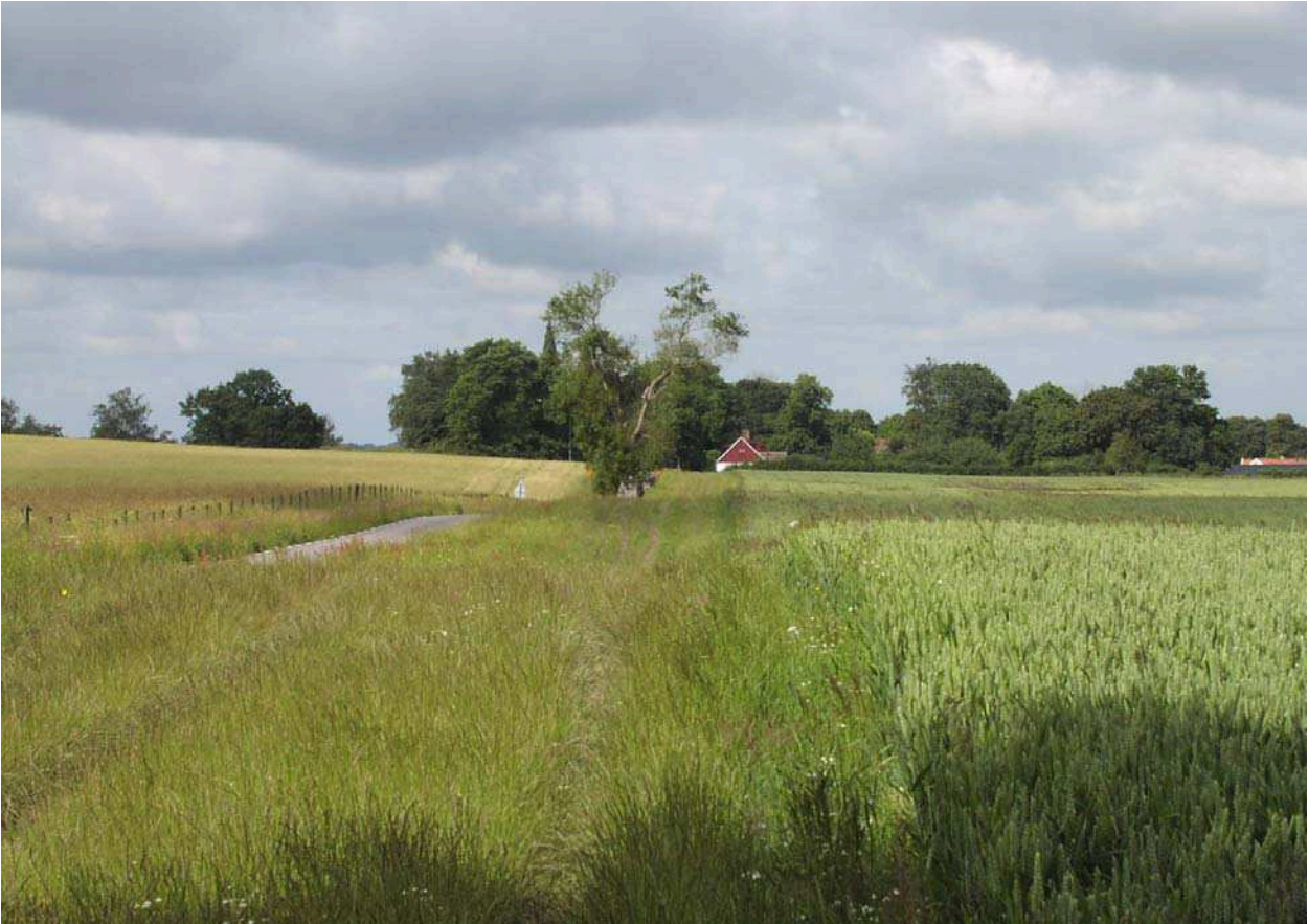
Lyngby by, sedd från väster