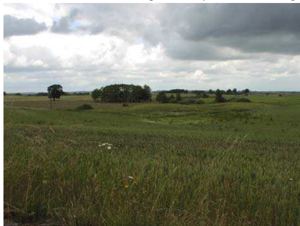
Varierat odlingslandskap vid Hässleberga