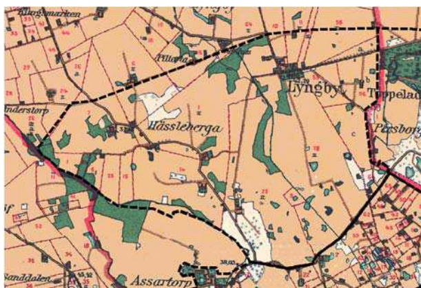
Häradsekonomska kartan 1912