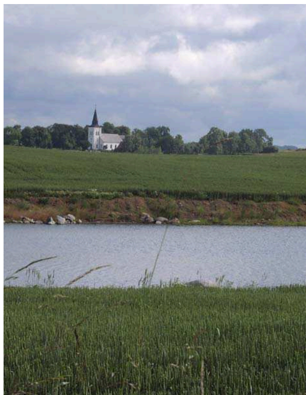
Lyngby kyrka, sedd från Hässleberga