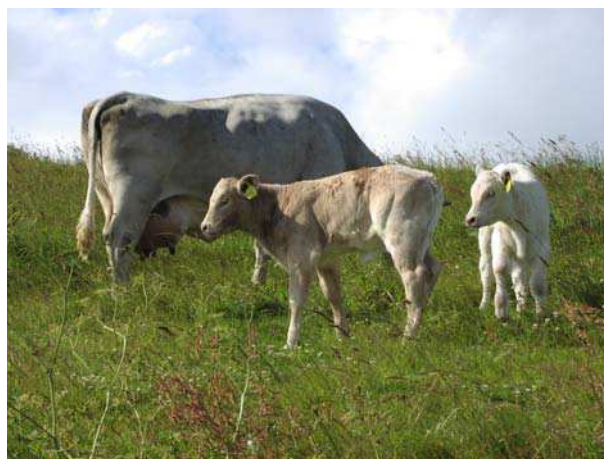
Betesdjur i Hässleberga