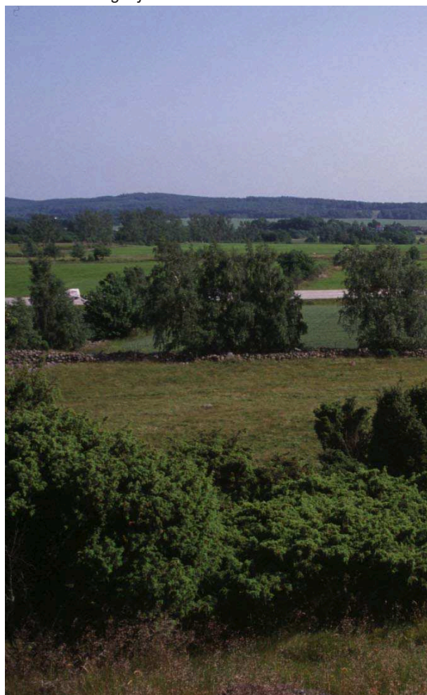
Utsikt från Högebjär mot söder

Park- och naturvårdsnämnden. 1990. Naturvårdsplan för Lunds kommun.