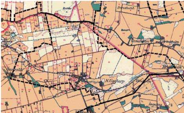
Häradsekonomska kartan 1912

landskapet såg ut innan skiftena. På fäladerna finns spår av äldre markanvändning och fornlämningar som är viktiga att bevara. Skifteslandskapet är tydligt genom de många hägnadsvallarna, ägo gränserna och den småskaliga bebyggelsen. Järnvägen och bebyggelsen kring Björnstorps station ger en god bild av den industriella utvecklingen i slutet av 1800-talet.