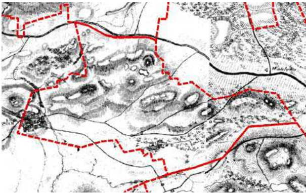
Skånska rekognosceringskartan 1812-20