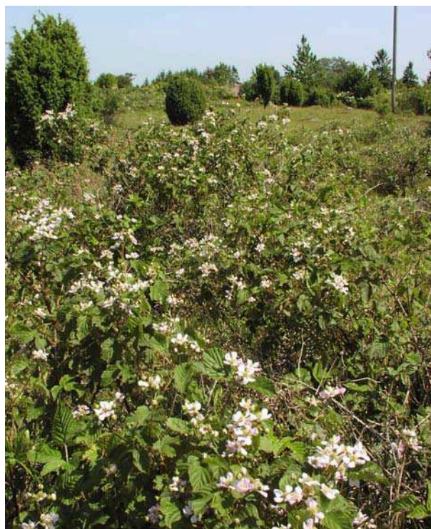
Björnbärssnår på Önnestövs fälad

Odlingsrösen i fäladsmarken vittnar om äldre tiders åkerbruk