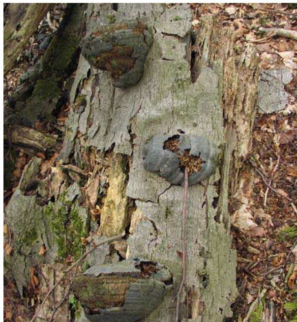
Vid Ugglarps bygdegård finns mycket död ved

Park- och naturvårdsnämnden. 1990. Naturvårdsplan för Lunds kommun.