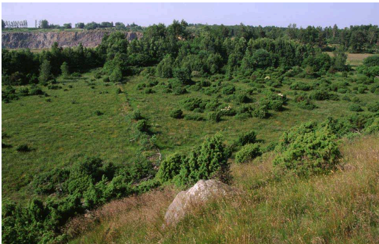
Utsikt norrut från Högebjär mot Önnestövstället (Dalby stenbrott)