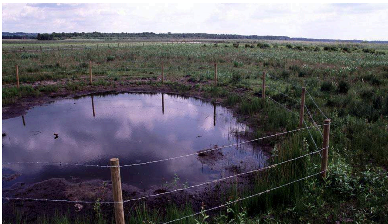
Nygrävd groddamm på Revingefältet vid Sjötorp, väster om Krankesjön