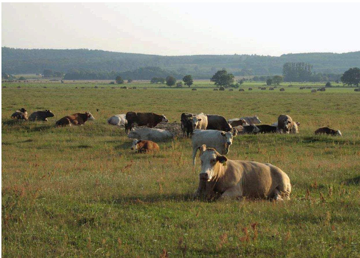
Betande nötkreatur på Revingefältet