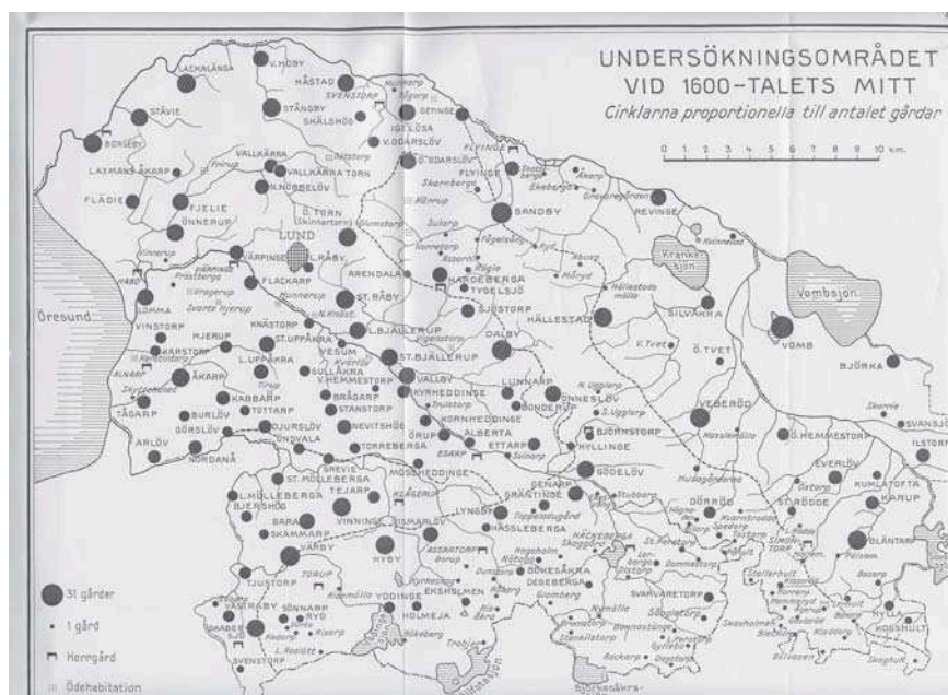
Byar i Bara och Torna härad på 1600-talet (efter Dahl 1942).

och äng kallas för ”inäga” och var avskilt från ”utmarken” som användes som betesmark. I Skåne benämns dessa utmarker ofta för ”fälader”, vilket kommer från danskans ”fælles” = gemensam, och syftar på att betesmarken användes gemensamt av byns brukare. Ägandet av utmarken var inte klart fastställt och ofta hade centralmakten utpekat utmarksområden som sina där byborna endast hade rätt att bedriva bete och göra visst uttag av ved och virke. På 1200-talet räknades all utmark som kungens egendom. I slättlandskapet blev efterhand större delen av landskapet koloniserat på bekostnad av utmarkerna och det uppstod en brist på virke och ved. Romeleåsen och Backlandskapet hade fortfarande stora skogsområden och det skedde ett utbyte av produkter mellan dessa områden och slätten. I backlandskapet och på Romeleåsen fanns få byar men ett flertal ensamgårdar. Många byar låg i kanten av området och kunde då både dra fördel av åkerbruket på slätten och boskapsdrift och virke/ved från utmarken. Vombslätten skiljde sig från de övriga områdena genom de sandiga markerna som var lättbearbetade men urlakade på näringsämnen. Här utvecklades ett extensivt odlingsystem med långa trädor och odlingar i tvåsåde, dvs korn och råg som alternerade i de stora vångarna. Här fanns också inslag av bovete på de sämsta markerna.