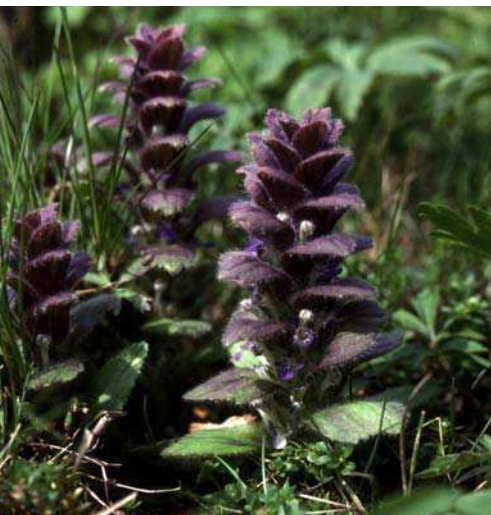
Blåsugan, en växt som bara växer i gamla betesmarker.

värmeperiod då medeltemperaturen var ett par grader högre än idag vilket motsvarar dagens klimat i nordöstra Frankrike. Troligen var de frodiga skogarna inte helt slutna utan stora betesdjur som uroxer och visent höll gläntor öppna där ängsmarkens flora och fauna kunde utvecklas.