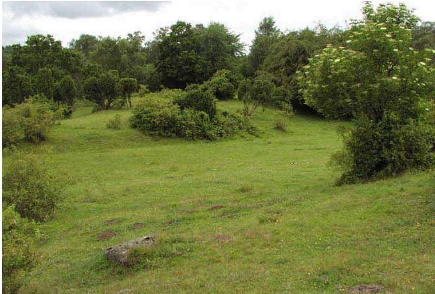
Måryd. Gamla betesmarker med en mycket rik flora och fauna som utvecklats i samverkan med markanvändningen.