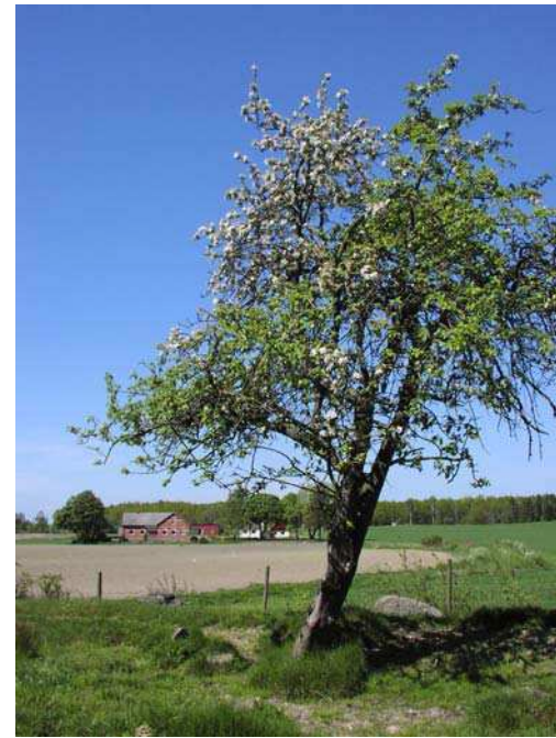
Söder Eneberga vid Kvarnbrodda

Under medeltiden låg adelns och kyrkans mark utspridd och brukades av arrendatorer. Adelns huvudgårdar låg bland de andra gårdarna i byarna. I slutet av medeltiden växte dock både adelns och kyrkans makt och de började genom byten och köp att samla markinnehavet och uppföra nya huvudgårdar utanför byarna. En viktig aspekt var uppfödandet av oxar och hästar som krävde stora betesmarker och gjorde att många nya huvudgårdar kom att anläggas i anslutning till utmarksområden. Oxexporten till kontinenten från Skåne och övriga Danmark inbringade mycket stort kapital till högadeln. Genom reformationen 1536 ökade kronans egendomar kraftigt och många av dessa övergick sedan till adeln genom försäljning och gåvor för tjänster. I Lunds kommun dominerar fortfarande tre stora gods, Häckeberga (äger nästan hela backlandskapsdelen av kommunen), Björnstorp och Svenstorp (de sistnämnda har samma ägare). Det finns även några mindre huvudgårdar som periodvis varit adelsgårdar, t ex Flyinge, Ugglarp och Assartorp. Toppeladugård hörde till Häckeberga gods fram till 1700-talets slut.