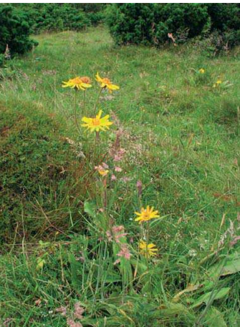
Slättergubbe i Gödelövs fålad