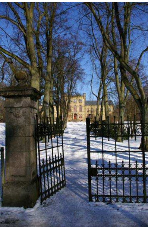
Institutionsbyggnad mellan professorsstaden och centrum.

Autostradan mellan Malmö och Lund var Sveriges första motorväg och invigdes 1953. Andra viktiga vägbyggen var väg 11 mot Veberöd och Sjöbo, väg 108 från Staffanstorp till Kävlinge samt de många kringfartslederna runt Lund. De nya vägarna leder ofta till omarronderingar som gör att gamla strukturer i landskapet utplånas och historiska sammanhang går förlorade. Biltrafiken har också bidragit till en bullerpåverkan som gör att få områden i kommunen idag kan upplevas som tysta. Etableringen av Sturups flygplats 1972, på gränsen till kommunen i sydväst, har också bidragit till bullerbelastningen. Järnvägen däremot har haft en tillbakagång under mitten av 1900-talet i takt med biltrafikens utveckling. Flertalet linjer i kommunen är nerlagda och idag är det bara Stambanan och Väst kustbanan som är i trafik. För framtiden planeras dock återupptagen järnvägstrafik bl.a. via Dalby och Staffanstorp mot Sjöbo och Simrishamn. Den fortsatta utbyggnaden av såväl vägar som järnvägar skapar nya barriärer som leder till en ökad fragmentisering av naturen och försvårar för såväl människor som djur att röra sig i landskapet.