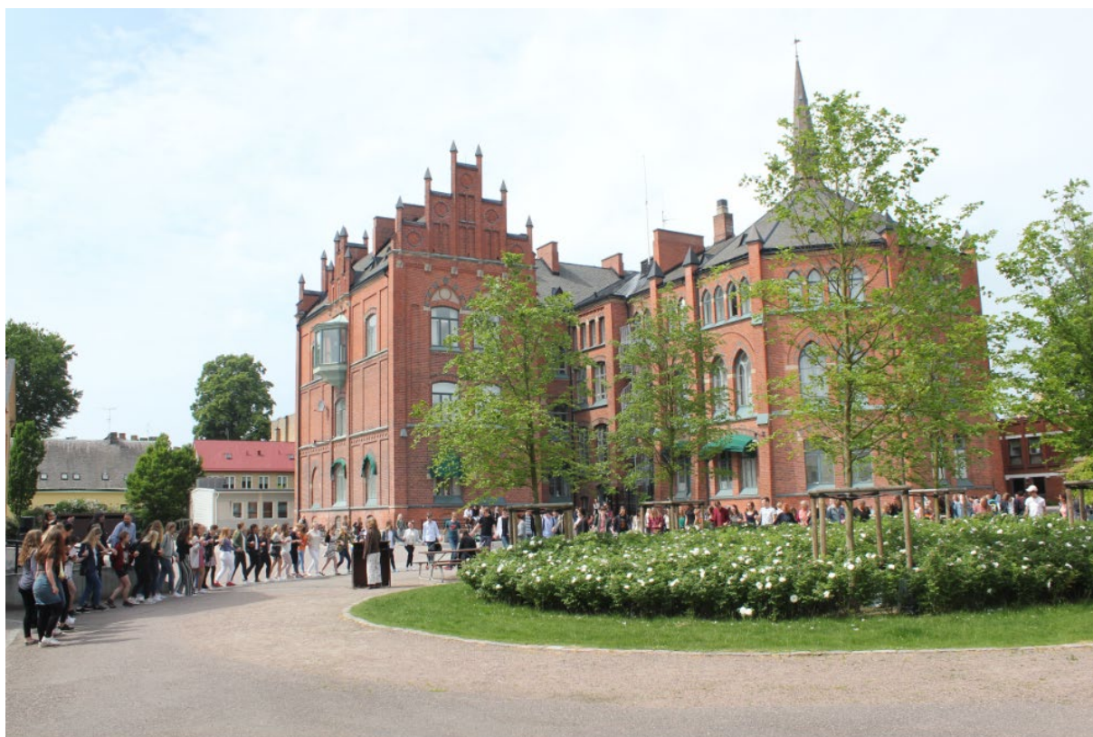
Bokdans på Katte